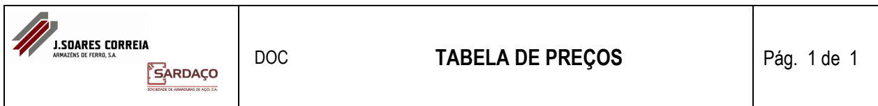
TABELA DE PREÇOS DE VENDA